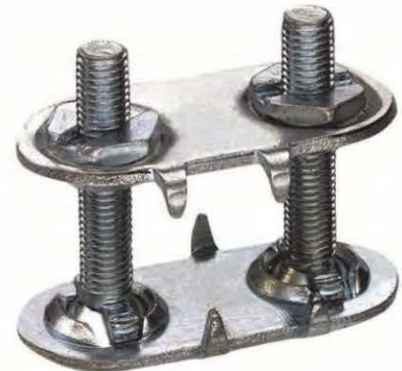
上下扣盘材质：特殊钢 钢质系列皮带扣适用于通用用途