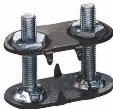
上扣盘材质：高强度钢 下扣盘材质：特殊钢